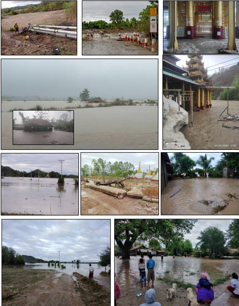
စစ်ကိုင်းတိုင်းနှင့် မကွေးတိုင်းအတွင်း ရေကြီး ရေလျှံမှုများနှင့် ပျက်စီးမှု အချို့

၂။ မိုခါဆိုင်ကလုန်းမုန်တိုင်း၏အရှိန်ကြောင့် မေလ ၁၅ ရက်နေ့တွင် စစ်ကိုင်းတိုင်း အထက်ပိုင်းနှင့် ကချင်ပြည်နယ်တို့တွင် နေရာအနှံ့အပြားမိုးထစ်ချွန်းရွာပြီး အချို့နေရာများ တွင် နေရာကွက်၍ မိုးကြီး နိုင်ပါသည်။ မိုခါဆိုင်ကလုန်းမုန်တိုင်းနှင့်အတူ မေလ (၁၆)ရက် နေ့မှ စတင်ကာ မြန်မာနိုင်ငံတောင်ပိုင်း ဒေသများသို့ အနောက်တောင် မုတ်သုံလေ စတင် ဝင်ရောက်လာနိုင်ပါသည်။ မုန်တိုင်းနှင့်အတူမိုးကြီးခြင်း ကြောင့် ရှမ်းပြည်နယ်၊ စစ်ကိုင်းတိုင်း နှင့် မကွေးတိုင်းတို့ရှိ အချို့သောဒေသများတွင် မြေပြိုခြင်း၊ ဆည်များ ကျိုးခြင်းနှင့် ရေကြီး ရေလျှံခြင်းများဖြစ်ပွားလျက်ရှိပါသည်။