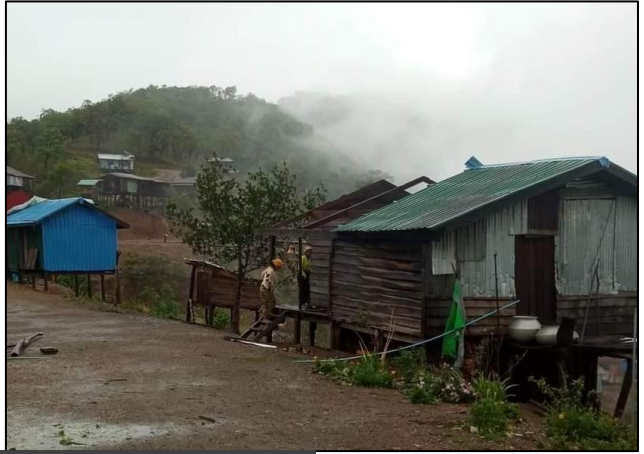
ချင်းပြည်နယ်မှ ထိခိုက်ပျက်စီးမှုများ