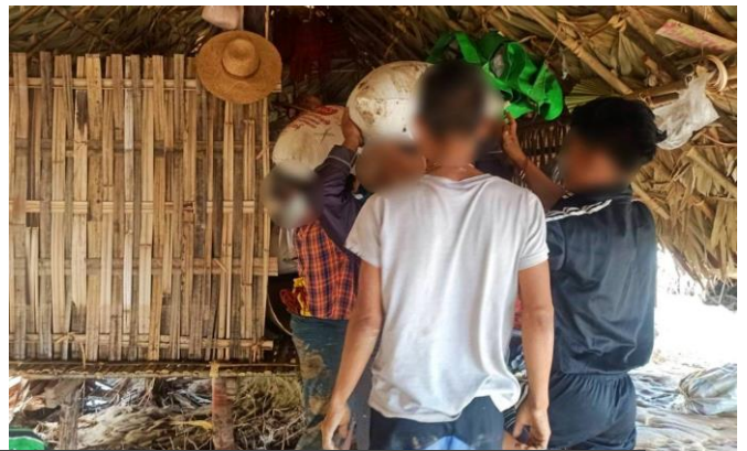
စစ်ကိုင်းတိုင်းအတွင်း လူသားစာနာအဖွဲ့မှ အရေးပေါ် တုံ့ပြန် ကယ်ဆယ်ရေး ကွင်းဆင်းဆောင်ရွက်မှုများ

၅။ ရန်ပုံငွေထောက်ပံ့မှုအပိုင်းတွင် အမျိုးသားညီညွတ်ရေးအစိုးရအနေဖြင့် မိုခါဆိုင်ကလုန်း မုန်တိုင်း အရေးပေါ်တုံ့ပြန်ရေးအတွက် အမေရိကန်ဒေါ်လာ(၁)သန်း ပံ့ပိုးဆောင်ရွက်မည်ဖြစ်ပြီး ထောက်ပံ့ ဖြန့်ဝေမှုများကို မြေပြင်လိုအပ်ချက်အပေါ်မူတည်၍ အမျိုးသားညီညွတ်ရေးအစိုးရနှင့် ချိတ်ဆက် ပူးပေါင်းဆောင်ရွက်လျက်ရှိသည့် သက်ဆိုင်ရာ အဖွဲ့အစည်းအသီးသီးမှတစ်ဆင့် ထောက်ပံ့ပေးမည် ဖြစ်ပါသည်။ အရေးပေါ်အခြေအနေ စီမံ ခန့်ခွဲမှုဆိုင်ရာ ပေါင်းစပ်ညှိနှိုင်းရေးကော်မတီအောက်ရှိ လုပ်ငန်း အဖွဲ့(၈)ခုက မိုခါဆိုင်ကလုန်းမုန်တိုင်း အရေးပေါ်တုံ့ပြန်ရေးအတွက် သုံးစွဲရန်လိုအပ်မည့် လုပ်ငန်းများ အတွက် ကဏ္ဍအလိုက် သုံးစွဲကြရန်လည်းဖြစ်ပါသည်။ ၂၀၂၃ခုနှစ်၊ မေလ ၁၅ ရက်နေ့အထိ မိုခါ ဆိုင်ကလုန်း အရေးပေါ်တုံ့ပြန်ရေးအတွက် အမျိုးသားညီညွတ်ရေးအစိုးရက ပံ့ပိုးထောက်ပံ့မှုများမှာ အောက်ပါအတိုင်း ဖြစ်ပါသည်-