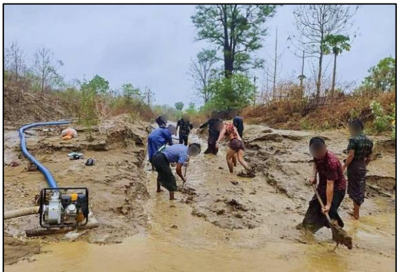
မကွေးတိုင်းအတွင်း သက်ဆိုင်ရာ တာဝန်ခံများ/PDFများက အရေးပေါ် ရွှေ့ပြောင်းပေးမှုများနှင့် အပျက်အစီး ရှင်းလင်းမှုများ ဆောင်ရွက်နေပုံ