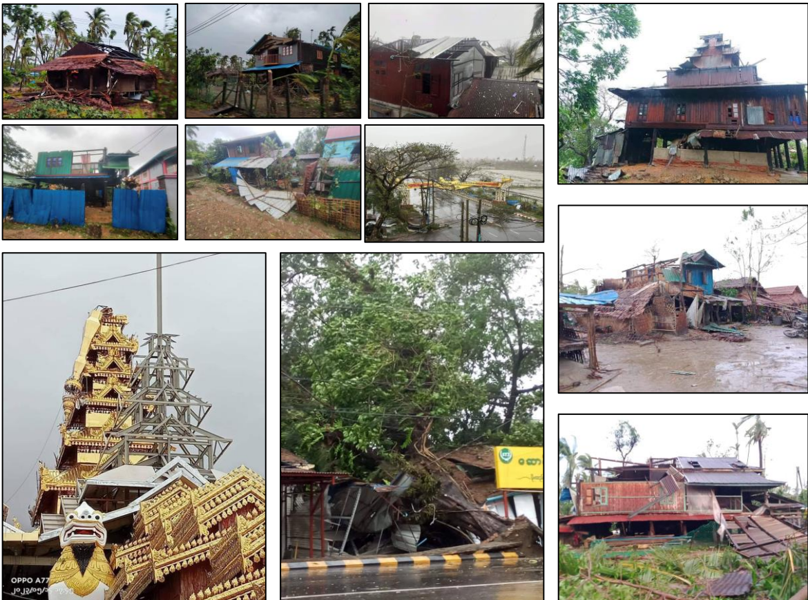
ရခိုင်ပြည်နယ် စစ်တွေ၊ ကျောက်တော်၊ ဝှ၊ မြောက်ဦးမြို့နယ်များမှ ထိခိုက်ပျက်စီးမှုများ

၃။ မိုခါဆိုင်ကလုန်းမုန်တိုင်းနှင့် ဆက်စပ်၍ နောက်ဆက်တွဲဖြစ်စဉ်များကြောင့် ရခိုင်၊ ရှမ်း၊ မန္တလေး၊ ဧရာဝတီ၊ စစ်ကိုင်း၊ မကွေးနှင့် ရန်ကုန်တို့တွင် သေဆုံးသူစုစုပေါင်း (၁၈) ဦး ရှိခဲ့ပြီး ထိခိုက်ဒဏ်ရာရသူများနှင့် နာမကျန်းဖြစ်ပွားသူများလည်း ရှိကြောင်းသိရပါသည်။ နေအိမ်ပျက်စီးမှုများ၊ အခြေခံ အဆောက်အအုံပျက်စီးမှုများ၊ လမ်း၊ တံတား ပျက်စီးမှုများ၊ စိုက်ပျိုးသီးနှံများ ရေလွှမ်းမိုးခြင်းနှင့် ပျက်စီးခြင်းများ၊ ကျွဲ၊ နွား၊ ဆိတ်၊ ဝက်များ ရေထဲမျောပါ သေဆုံးခြင်းများ ဖြစ်ပွားခဲ့ပါသည်။ ထိခိုက် ပျက်စီးမှုများကို ရခိုင် ပြည်နယ် တွင် အများဆုံး ကြုံတွေ့ခဲ့ရပြီး မကွေးတိုင်းနှင့် စစ်ကိုင်းတိုင်းတို့သည် ဒုတိယ ထိခိုက်မှုအများဆုံးဖြစ်ပါသည်။ အခြားသော ချင်းပြည်နယ်၊ ကချင်ပြည်နယ်၊ ပဲခူးတိုင်း၊ ဧရာဝတီတိုင်းတို့တွင် လည်း ပျက်စီးဆုံးရှုံးမှုများ ဖြစ်ပွားခဲ့ပါသည်။ မေလ ၁၅ ရက်နေ့အထိ ရရှိထားသော စာရင်း ဇယားများအရ ရခိုင်ပြည်နယ်တွင် အထင်ကရ နေရာများဖြစ်သည့် ကျောက်တော်မဟာမြတ်မုနိဘုရား၊ စစ်တွေ ရှုခင်းသာလမ်းများ ထိခိုက်ပျက်ဆီးခဲ့ပြီး အိမ်ခြေ ထောင်သောင်းကျော် အမိုးအကာ ပျက်စီးမှုများ ဖြစ်ပွား ခဲ့ပါသည်။ စစ်ကိုင်းတိုင်း ဒေသကြီးတွင် မြို့နယ် (၂) မြို့နယ်၊ ကျေးရွာ (၃၄) ရွာမှ လူဦးရေ (၂၂,၂၀၉) ဦးနှင့် မကွေးတိုင်းတွင် မြို့နယ်(၂) မြို့နယ်မှ လူဦးရေ (၂,၄၆၂)ဦး မုန်တိုင်းကြောင့် အရေးပေါ် ရွှေ့ပြောင်းကြရပါသည်။ ထိခိုက်ပျက်စီးမှု အသေးစိတ်ကို နောက်ဆက်တွဲစာရင်းဖြင့် ဖော်ပြ အပ်ပါသည်။